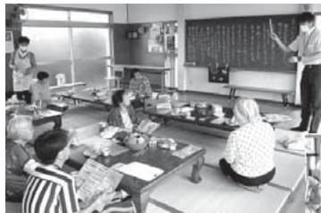
◀出前講座：マイナンバーカード持っとけば便利になるとね～！