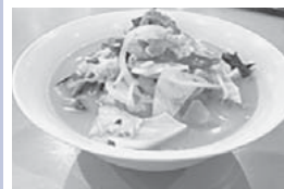
ヘルシーランド薬師温泉