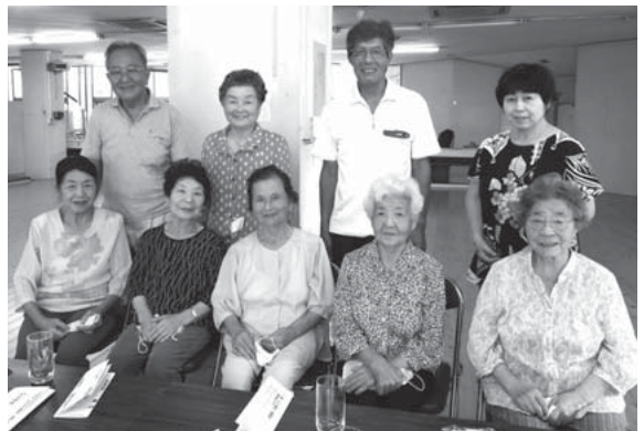
▲いくつになっても「ときめき」を持って輝きます！

問い合わせ 高齢福祉課 ☎ 45-7215 / 社会福祉協議会 ☎ 49-4505