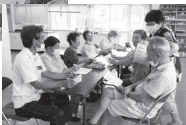
「いろいろクイズ」で懐メロ♪やことわざなど、「じゃった、じゃった！」と賑わいます！