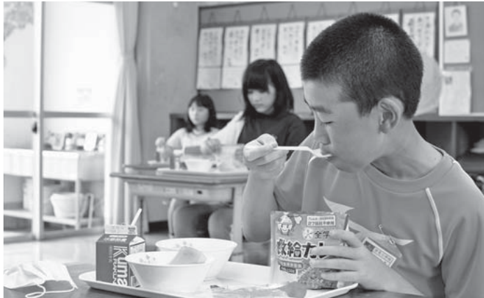
▲備蓄食料のカレーをいただきます！

9月1日の「防災の日」に合わせて、町内の小中学校の給食に防災備蓄食料である「救給カレー」が提供されました。これは防災教育の一環として取り組まれている体験学習です。