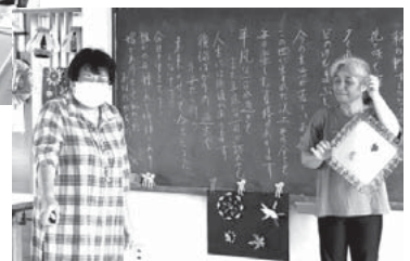
それぞれの得意なことを活かし楽しいサロンを作り上げていきます♪