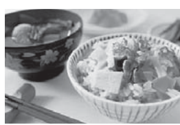
あさぎりフレッシュフーズ