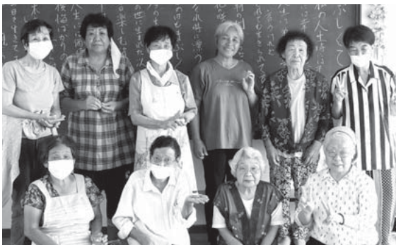
▲月1回のサロンに元気をもらいにきています♪

また、吉井住宅にはサロンリーダーを支える心強いサロン協力隊がいます。毎回サロン終了後、皆さんで次回の内容や準備物の確認を行っています。季節を感じる工夫を凝らした製作物は外出先で見つけた飾りなどをヒントにしているそうです。参加者も「今日は何を作るかいつも楽しみ♪」と喜ばれています。