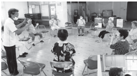
◀サロンリーダーの「脳トレ」に自然と笑い声が♪

皆さん体操から会場の片付けまで背筋もピシャッと軽快に動かれます。最高齢は94歳(!)とのことですが、とても若々しい姿に驚きました！サロンに寄れば「久しぶりのおしゃべりが楽しみ！」と皆さん顔がほころびます。自分で歩ける範囲にこんな素敵な通いの場があると、心と身体の健康を楽しく維持できると実感しました♪