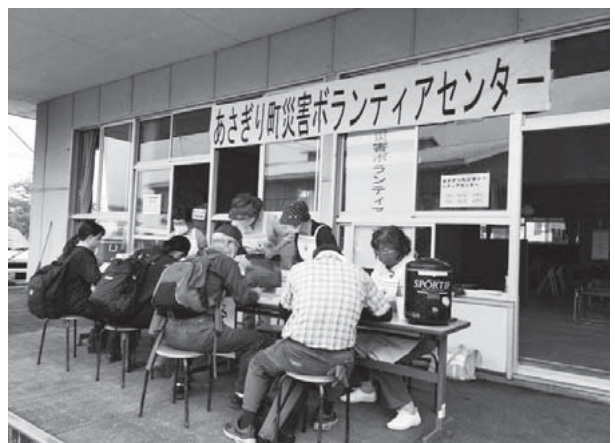
▲ボランティアセンターでの受付の様子

毎年、災害ボランティアの訓練があり参加しますが、今回の災害を受け改めて、冷静な判断ができるか、そして婦人会としての役割について今一度確認しなければと感じました。