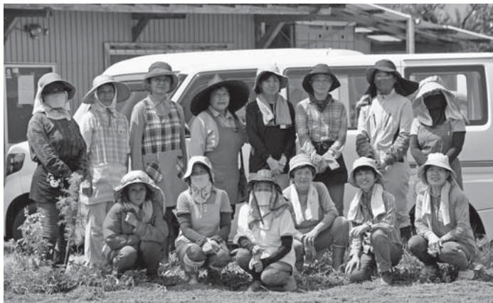
▲農業女性の会の皆さん