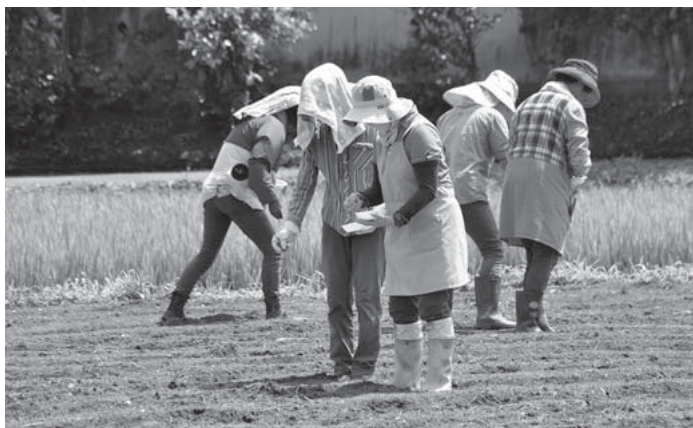
▲ひまわりの種まきの様子

農家の女性で構成される「農業女性の会」の活動の一環として、遊休農地へのひまわりの種まきが行われました。