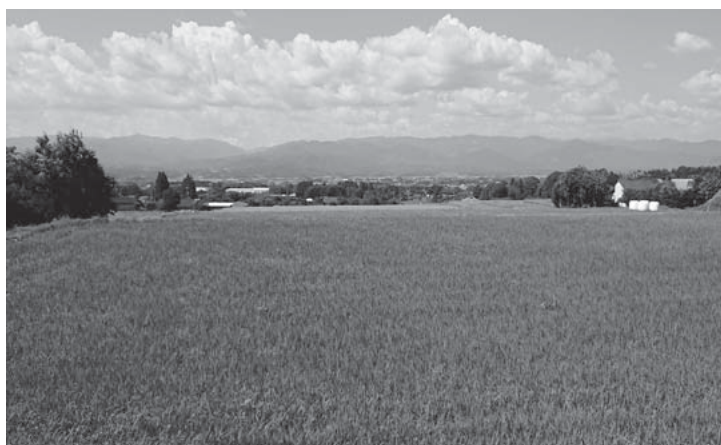
▲白髪岳のすそ野から町を望む

出先で気に入った風景があったら写真を撮るようにしているのですが、ほんとうに気持ちの良い景色が多くて困っています。もともとこちらに住んでいる方にとっては普通の風景かもしれませんが、自分からすると見晴らしがよく気持ちよかったりなぜか撮りたくなったりしてしまいます。まだまだ色々な景色がみてみたいですね。