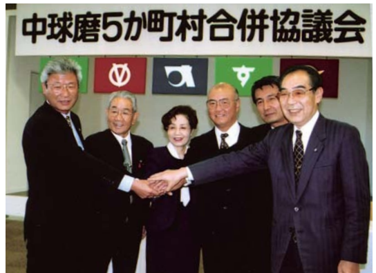
中球磨5か町村長による 合併協定書調印式