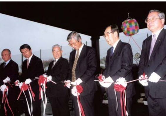
あさぎり町発足 （開庁式でのテープカット）