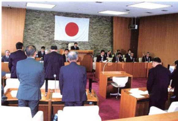
中球磨5か町村議会、廃置分合関連 四議案を議決