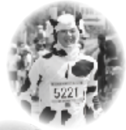
▲ゴールした参加者は須恵小プールで水浴び