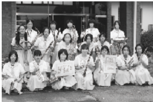
▲金賞を受賞した免田中吹奏楽部

先日行われた南九州地区吹奏楽コンテストには9団体が出演し、免田中は奨励賞を受賞。目標達成はなりませんが、今後も活躍を期待しています。