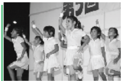
▲D! ガールズのダンス。うまい！