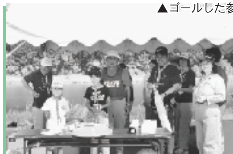
▲エードステーションのボランティアスタッフ