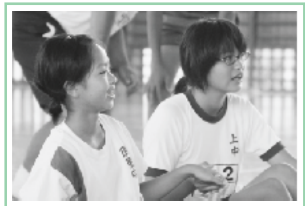
▲レクリエーションで交流