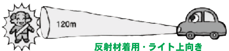
反射材着用・ライト上向き