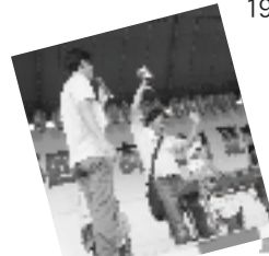
あまりの暑さにビール早飲みにも出場・・・。