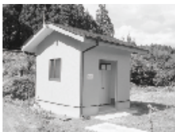
▲仁王地区共同トイレ

この整備により、住民の拠り所となっている毘沙門堂周辺が充実し、仏像彫刻・史跡・建造物、伝統芸能の保存継承活動に活かされ、また、地域住民と文化財見学者との交流する場所として益々の活性化が期待されます。