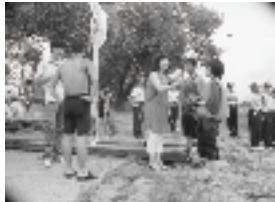
14:00～ イカダ下り 「青迅号」 しゅっぱーつ!