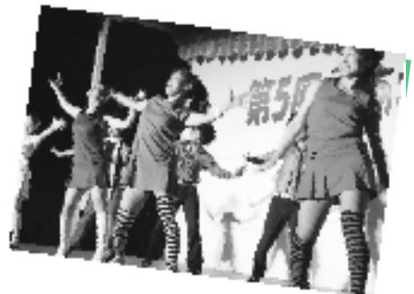
▲トリをつとめたSAKURA組