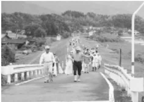
▲球磨川沿いの清掃

8月10日にふるさとのきれいな川と海を守り、次の世代に伝えていくことを目指した県民美化清掃活動『くまもと・みんなの川と海づくりデー』を実施しました。小雨が降るにも関わらず約2,700名の参加があり、道路沿いや河川敷のごみ拾い、草刈りなどが行われました。この日集まったごみの量は507kg（うち可燃ごみ274kg）でした。みなさんのご協力により大変きれいなあさぎり町になりました。ありがとうございました。