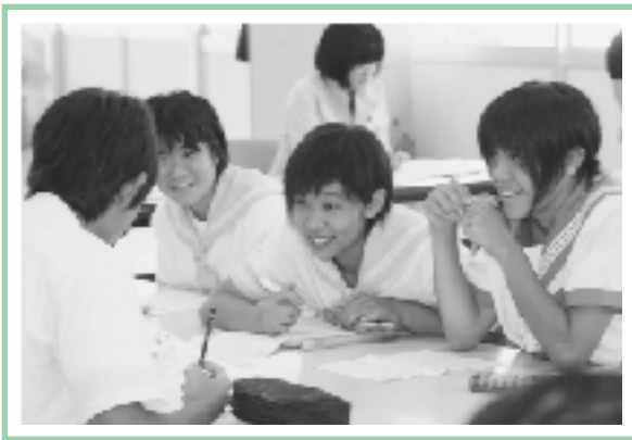
▲いろいろな意見を話し合い

5回目となる今回は、交流や親睦を深めるだけでなく、課題となっている中学校統合について生徒達の目線で考え、意見を出し合いました。生徒達による名刺交換が行われた後、愛甲町長の講話がありました。町の取組状況、将来像などを話した後、「目標を早く持ち、それに向かっ