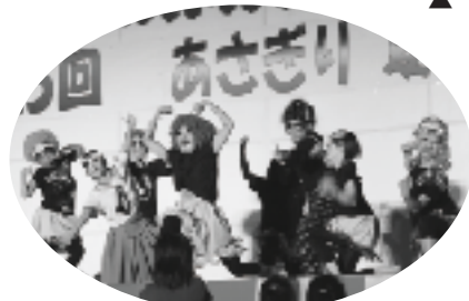
▲ウルトラの母に子供たちのエールが聞こえました