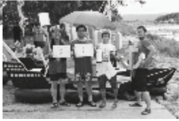
2部門入賞の▶ えびす丸