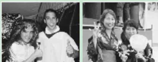
あさぎり夏まつりを楽しみました