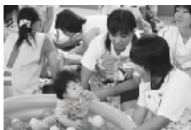
▲おもちゃを使ってふれあい

第1回目は、親の役割について講話があったあと、妊婦シミュレーターを使った妊婦疑似体験を実施。水などが入っている重さ12.3kgの妊婦シミュレーターを身につけ、妊婦さんが日常生活でも大変であることや、サポートしてくれる人が必要であることを体験しました。