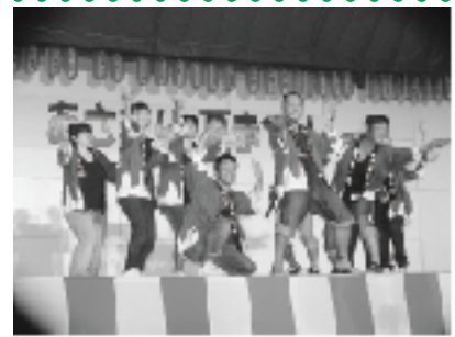
19:00～ ステージでのダンス

7月後半から8月にかけては主に祭りのボランティアスタッフとしての活動が多くなります。その中で夏の一大イベントが「あさぎり夏祭り」。実行委員をしながらの忙しい一日が始まります。