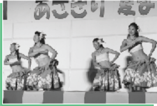
▲交流のある熊本市五福町のフラダンス

夏祭りに訪れた観客は約一万人。朝7時からの魚釣り大会で幕を開けました。イカダ下り大会、魚のつかみどり大会など、自ら参加できるイベントが多いのが夏祭りの魅力。ステージでも各種団体の多彩なパフォーマンスで観客を魅了しました。最後は間近で見られる打上花火で幕を閉じ、夏の楽しいひとときを過ごしていました。