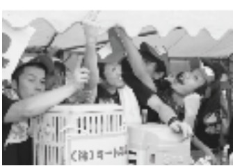
▲バザーも盛り上がりしました