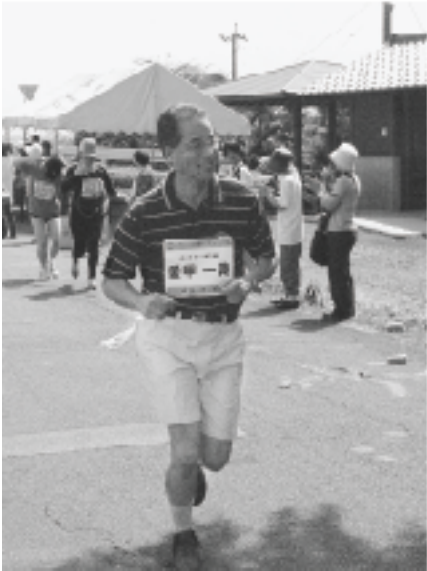
▲球磨川マラソン大会で5キロを走りました

「若いまち 豊かなまち」そして、夢ふくらむ『あさぎ町』は、あさぎ町の町づくりの目標として、とても素晴らしいと思います。私は、