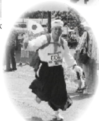
▲今年も応援ありがとうございます