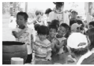
▲怖そうだけどたのしみ！