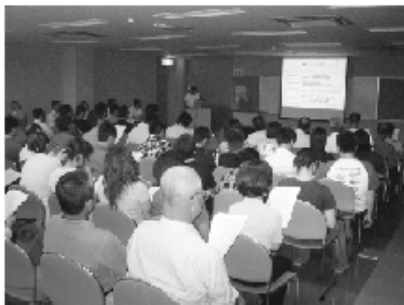
▲熱心に聞き入る参加者たち

説明会は、1校制または2校制にした場合の学校規模、校舎を新築・増築した場合の費用など、課題や問題点を示し、中学校統合に対する町民皆様の意見を聞くために行いました。