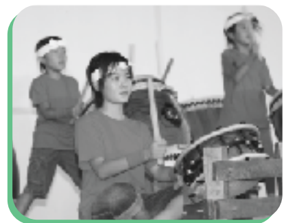
▲一期一会の太鼓演奏