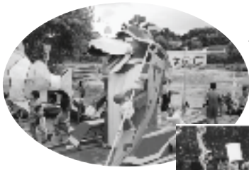
◀ヤッターワン号 見事な造りです