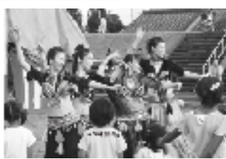
▲ベリーダンスにくぎづけ！