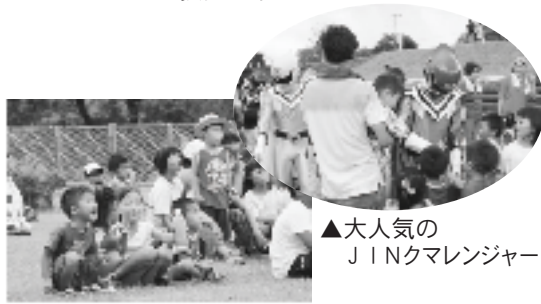
▲大人気のJINクマレンジャー