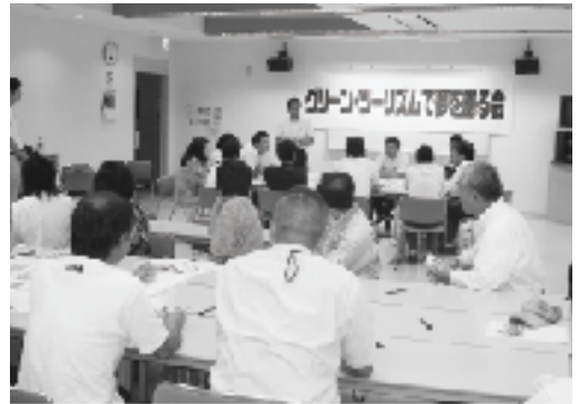
▲熱い議論をする参加者

今後は、夢を夢のままに終わらせるのではなく、皆様からの意見を元に、まずはすぐにでも出来そうな事から取り組んでいき、今回の取り組みは今後も継続的に続けていきたいと考えています。まちづくりに興味がある方はお気軽に次のお問い合わせ先へご連絡ください。