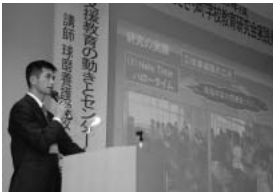
発表を行う免田小吉村教諭