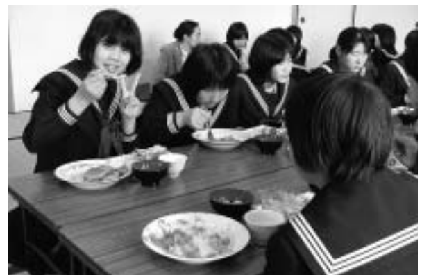
これで合格まちがいなし！

また、神社で合格祈願したシャープペンシルのプレゼントもあり、嬉しい感謝のランチタイムとなったようです。