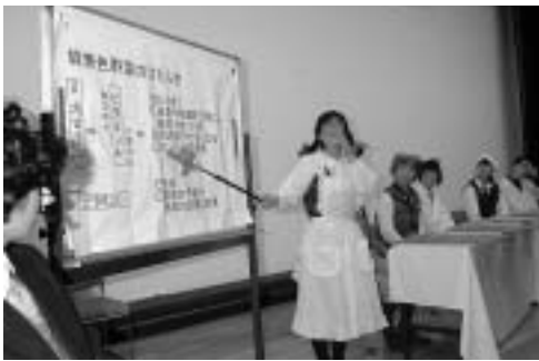
劇団「大根の花」によるにわか劇