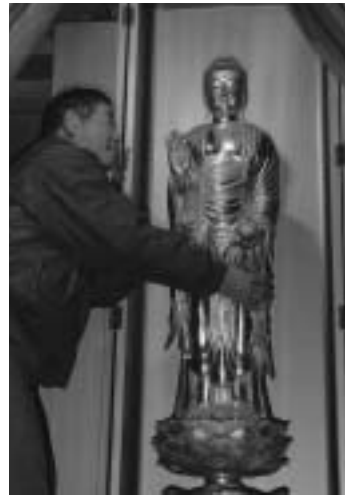
無事に戻り堂内に安置される薬師如来立像

なお、残る薬師如来坐像の所在は解っておらず、一連の盗難にあった仏像と共に早く戻ってほしいと担当部局で話しています。また、2月25日は、年4回開かれる谷水薬師大祭の日で「初薬師」と呼ばれており、参拝者にとって久しぶりの対面となりました。