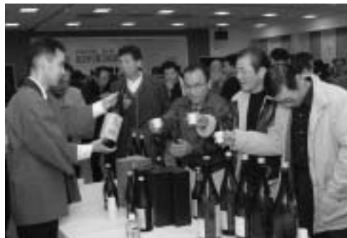
自分にピッタリの焼酎は見つかりましたか？

なお、売り上げ金の一部は盗難にあった仏像を買い戻した阿蘇釈迦堂、谷水薬師保存会に寄附されました。