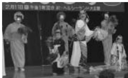
1歳と3歳のマツケンも登場 (美保理容室) 職場対抗歌合戦