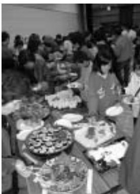
あっという間になくなった試食コーナー