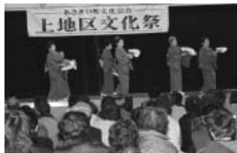
たくさんの催し物がありました

今年のテーマは「花開富貴」で、花開き富と名声を得るというテーマどおり、文化の花が咲き乱れていました。