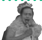
美空ひばりさんです