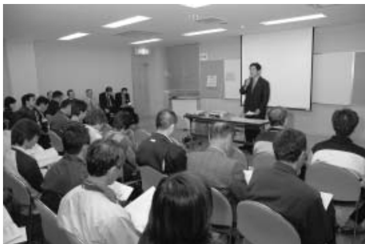
須恵文化ホール会場（11月9日）

町民の皆様は町政に対する理解をより深めていただく場として、平成18年10月23日の上小学校体育館を皮切りに11会場で平成18年度町政座談会が行われました。