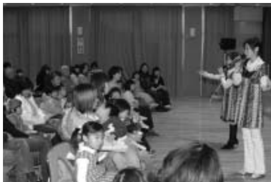
親子で楽しい時間を過ごしました

せきれい館自主事業として2月4日、「子どものための童謡コンサート」が行われました。テレビでも活躍中のDYO組が爽やかな歌声で、「早春賦」や「朧月夜」など春の歌など全20曲を披露。映画「となりのトトロ」のオープニング主題歌「さんぽ」では子どもたちも一緒にステージへ上がり大合唱し、保護者も手拍子や振りマネなどをして親子一緒に童謡を楽しんでいました。