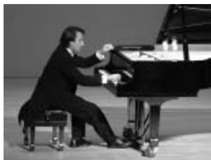
とにかく速すぎて指先が見えんとです！

曲を演奏され、超絶技巧なピアノテクニックで431人の聴衆を魅了しました。アンコールの最後には学校の下校曲でお馴染みの「別れの曲」が演奏され、サイン会では長蛇の列が並んでいました。