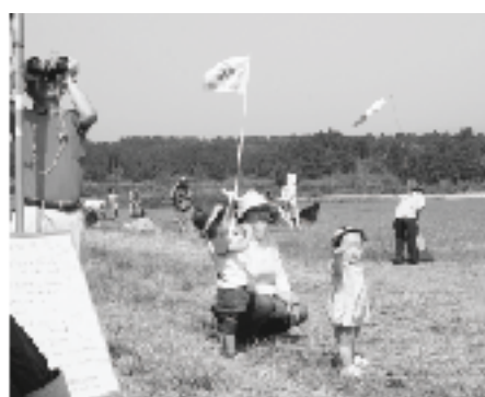
「じいちゃん、あそこに飛んどっばい」