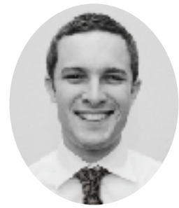
リチャード・ライト