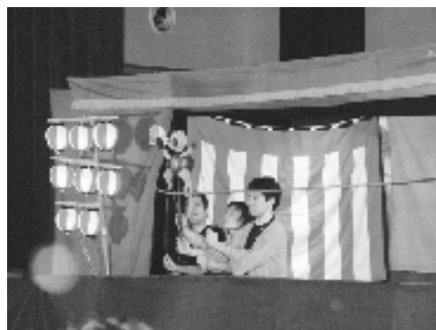
クライマックスの綱渡り

人形芝居かすべるは創立33年を迎え、熊本を中心に全国で活躍している劇団で、茶がまに化けた子狸の綱渡りに観客はドキドキハラハラしながら話の中に引き込まれていました。