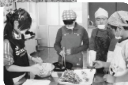
深田小特製「茶葉の天ぷら」