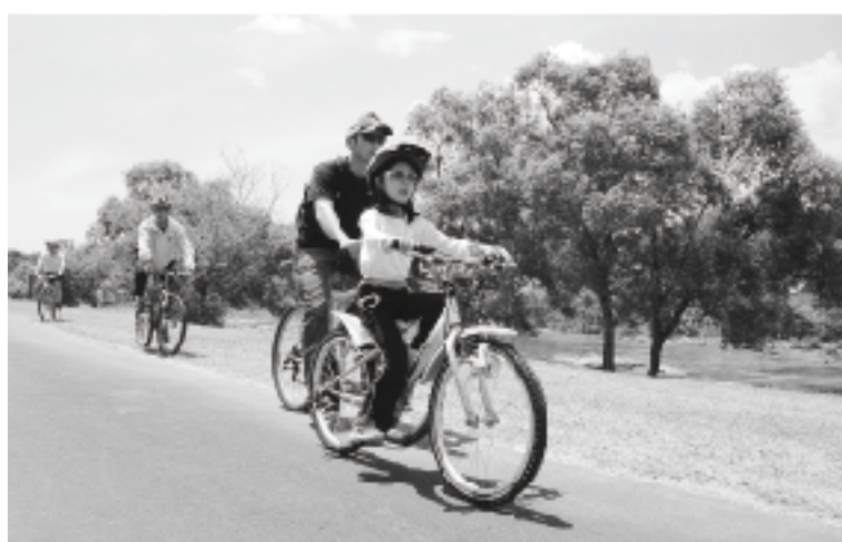
植木町から参加の宮田ファミリー

し合い、官民一体となって活用していきたい」と宣言、牛乳で乾杯して全線開通を祝いました。