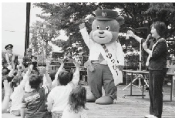
“ゆっぴー”の交通安全教室

人と、多良木署管内で交通事故が原因で亡くなった3人を合わせた110人を弔うため、湯前町の幼稚園児が110個の紙風船を飛ばし交通事故の根絶を願いました。