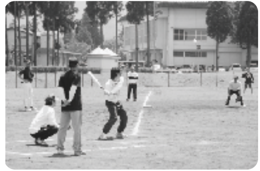
でるか!? ホームラン

絶好のスポーツ日和となった4月29日、第5回目を迎えた2007あさぎり町スポーツフェスティバルが開催されました。