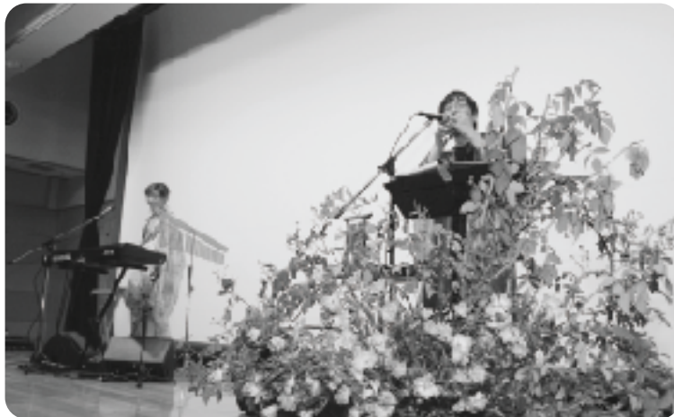
ツクシイバラに囲まれて演奏する“ピエント”

はツクシイバラを意識して見守るようにしていきます」「今年も聞きにきました。改めて、自然を守ろうと思いました」と話していました。