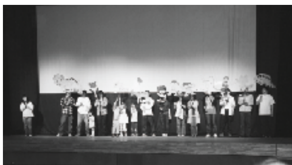
感動のフィナーレ

4月30日、須恵文化ホール自主文化事業として、人吉影絵サークル「まつぼっくり」の新作発表会が行われました。