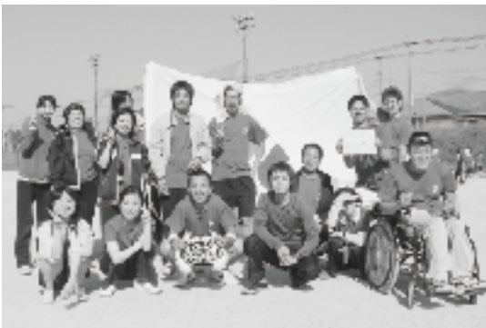
楽しく体育祭に参加することができました♪