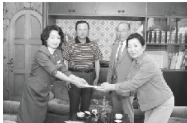
卒業生から母校へ 免田小（左）、須恵小（右）