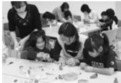
親子で粘土に挑戦！