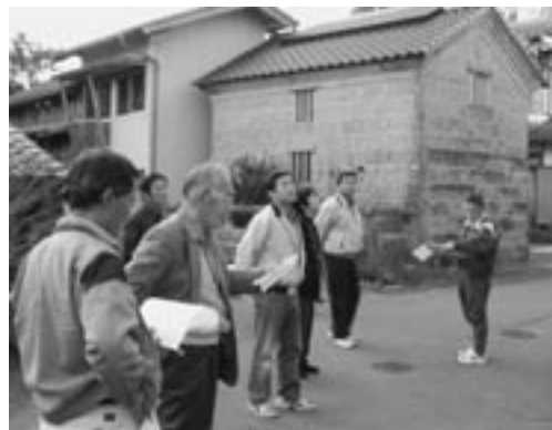
石倉を利用した農家民泊「華ごよみ」での散策

国土交通省の地域振興アドバイザー派遣事業が、11月22～23日の2日間にわたり行われました。