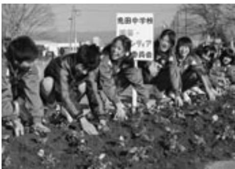
笑顔で花を植える免田中生徒

花壇いっぱいのは花は役場に訪れる人たちの目を楽しませてくれるでしょう。ありがとうございました。