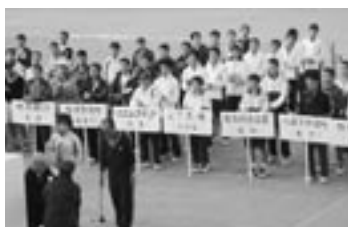
日本実業団リーグ開会式

11月12日、14日まで愛知県一宮市で開催された日本実業団リーグに九州代表として出場されました。