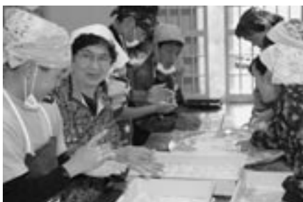
深田の手作りおやつ作り