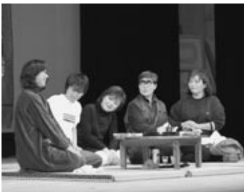
須恵のときめき一座

31日に開かれた深田校区は、「ふかだふれあい祭り」と題し小学校とせきい館において、深田小・中など合同で開催。ステージ発表のほか、児童がいも料理や手作りおやつ作りに挑戦しました。