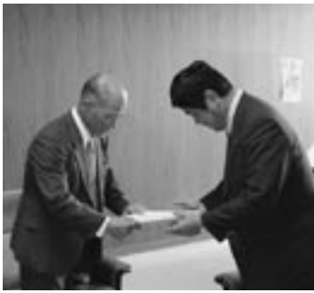
尾方委員長より犬童町長へ 答申書が手渡されました