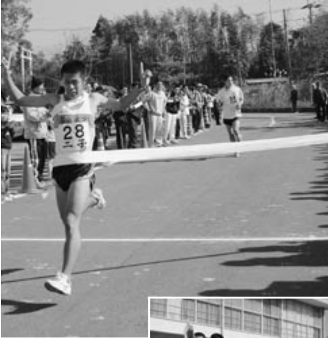
ゴール前で竹野地区をふりきる二子地区

た。沿道につめかけた多くの方々の熱い声援を背に受けた各地区代表の選手達がスタートし、朝霧晴れやまぬコースを走りました。