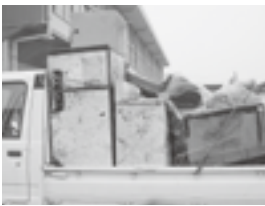
回収されたトラックに山積みのゴミ

第一六条の規定に違反し、廃棄物を捨てた者は、五年以下の懲役若しくは千万円以下の罰金に処し、又はこれを併科する。