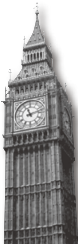
ロンドンにあるビックベン

イギリスでは、1年のうちで1番寒い月が1月です。この時期、イギリス北部では、たくさんの雪が降ります。しかし、私の故郷は南の方なのでわずかの雪しか降りません。