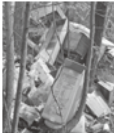
大規模林業に不法に捨てられたゴミ