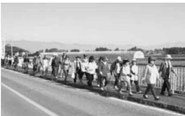
皆さん元気に完歩されました