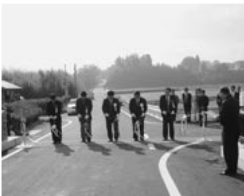
関係者によるテープカット

井上地区にある井上橋の改築工事落成式が、11月29日同橋下流の免田川河川敷において行われました。