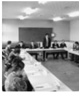
須恵校区地域 審議会の状況

11月17日から19日にかけて、各地区地域審議会が開催され、行財政改革や旧支所の活用方策について活発な議論が交わされました。今年度中に計画策定を予定してい