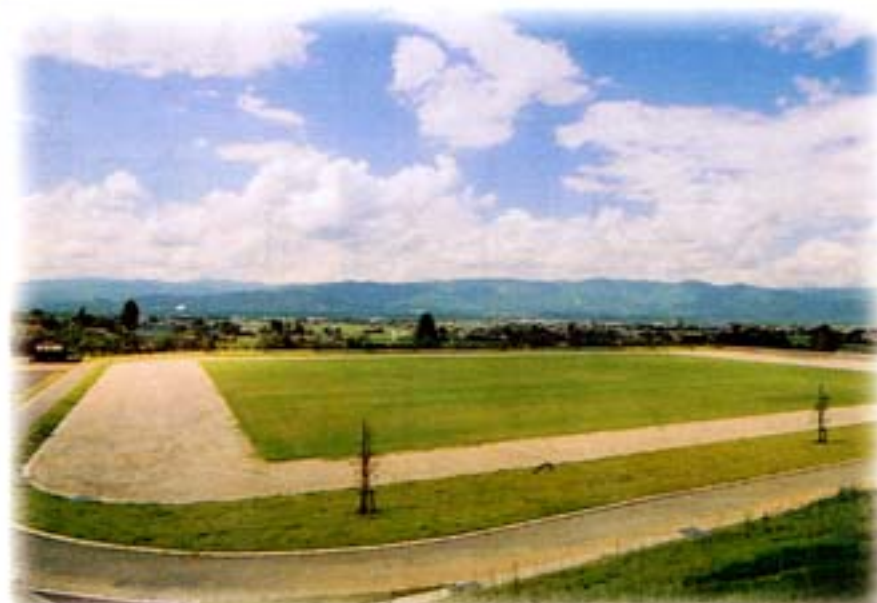
「森園カントリーパーク」