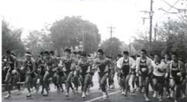
勢いよくスタートする選手