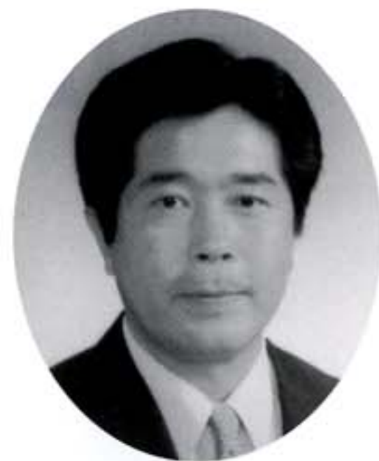
あさぎり町長 犬童卓一郎