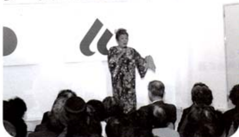
会場からは笑いの声