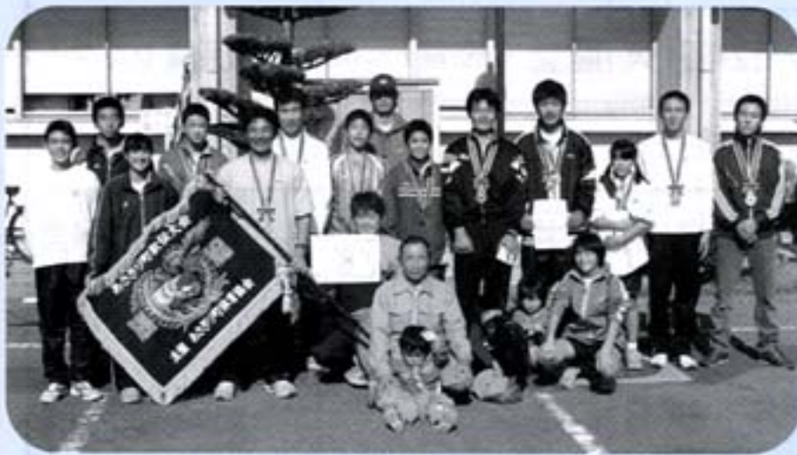
優勝の水岡地区チーム