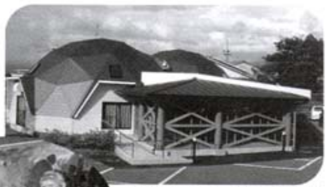
手前のテラス部分がもやいかん (後方のドーム型の部分はクラ フト館)