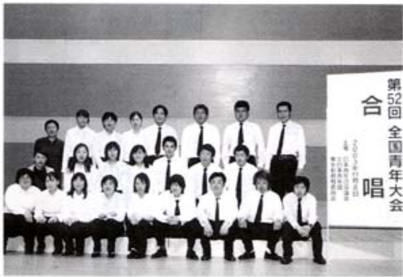
第52回全国青年大会 合唱

平成十五年十一月六日から十日まで に東京都一円において、全国青年大会 が開催され、わがあさぎり町青年団も 合唱・柔道に出場してきました。合唱 は六月に行われた郡予選、十月の県予 選を最優秀賞で飾り、全国行きの切符 を手に入れました。合併して初めての全 国大会ということで、団員の意気込み も十分で、合唱は全国大会も最優秀賞、 柔道は優勝を目指し練習を重ねてきま した。特に合唱に関しては、合併に伴 いに全国大会常連だった世代が抜け、 若い世代の団員がほとんどという状態 で郡の大会から半年以上練習を重ねて きました。