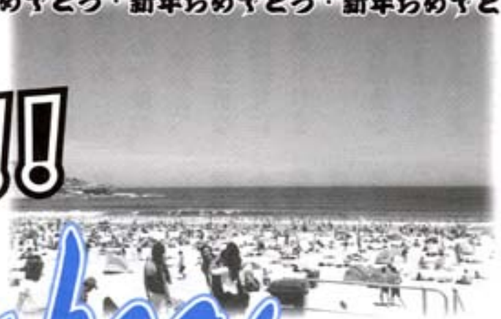
1月のオーストラリア