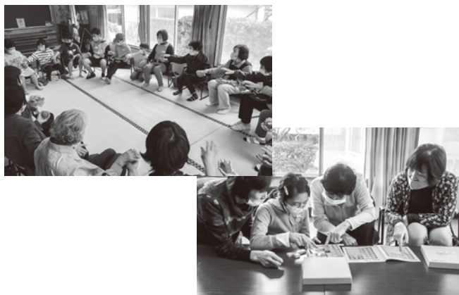
▲パズルやお手玉あそびにみんなで挑戦！