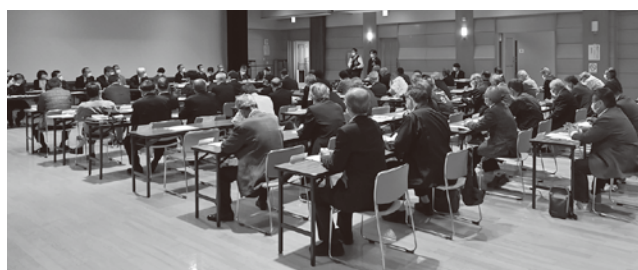
▲ 4月10日に開催された区長会の様子

行政区は、住民同士のコミュニティを形成し、防災や高齢者の見守り、子ども会などの活動を通じて、地域の課題を解決し、暮らしやすいまちづくりのための重要な役割を担っています。行政区への積極的な加入をお願いします。