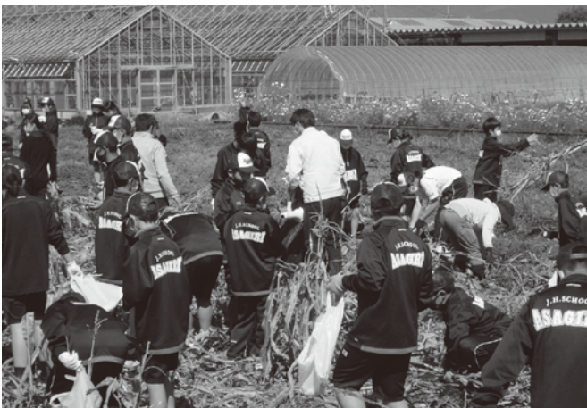
▲収穫の時を迎えて

中学校の近くにある熊本県農業試験場の体験農園において、球磨地域振興局農業普及振興課、町農林振興課、町企画政策課、町教育委員会、そして、元」A指導員のみなさんの協力のもと、昨年度は、1年生がスイートコーン、2年生がカボチャ、3年生が枝豆を栽培。植え付けから、管理、収穫に取り組みました。台風の影響などが心配されましたが、収穫した野菜は、自宅に持ち帰り、収穫の喜びを味わいました。しっかりと根付いてきた全校挙げての取り組みです。