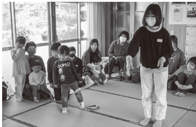
▲白熱したワナゲ大会でした！