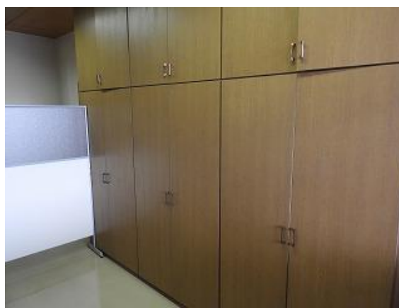
32) 旧上保健センター(準備室)