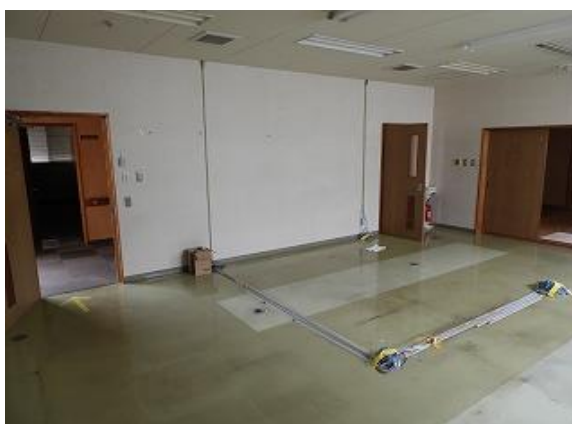
17) 旧上保健センター右側(訪問介護事業所)