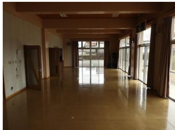
20) 旧上保健センター(集団検診室)西→東