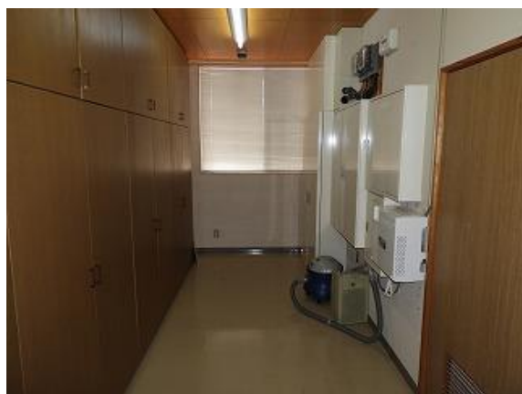
33) 旧上保健センター(記録保存室)