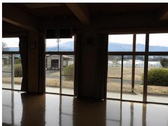
21) 旧上保健センター(集団検診室)テラス側