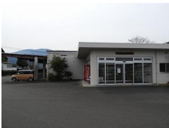
1) 旧上保健センター正面玄関側より