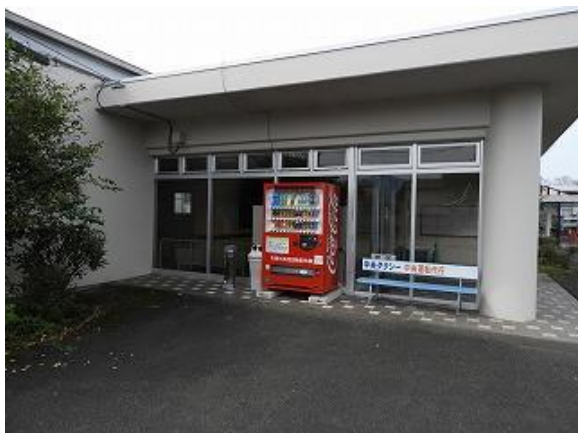
7) 旧上保健センター外観(東側より)