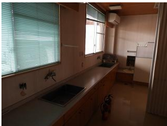
29) 旧上保健センター(問診室・診察室)流し台