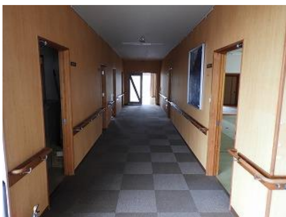
13) 旧上保健センター玄関前廊下