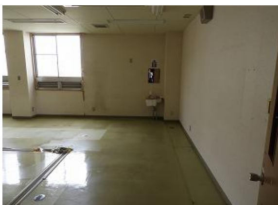
15) 旧上保健センター右側(訪問介護事業所)