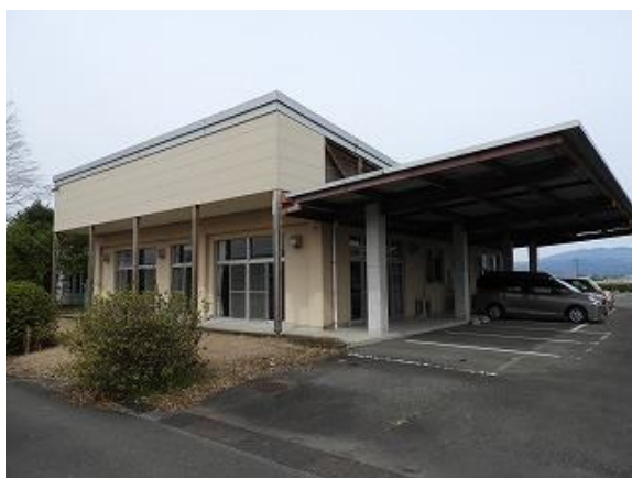
3) 旧上保健センター外観(南東側より)