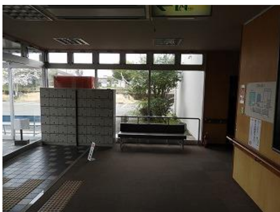
11) 旧上保健センター玄関(入室後左側)