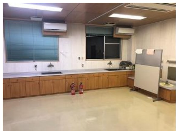
30) 旧上保健センター(問診室・診察室)