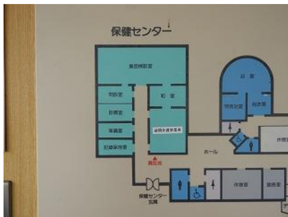
35) 旧上保健センター館内図