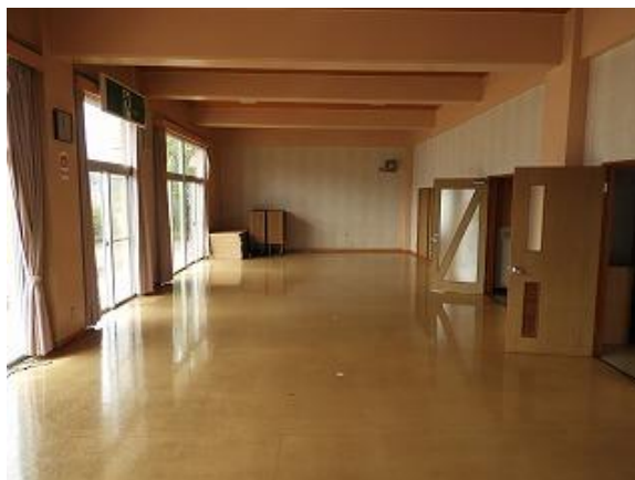
22) 旧上保健センター(集団検診室)東→西