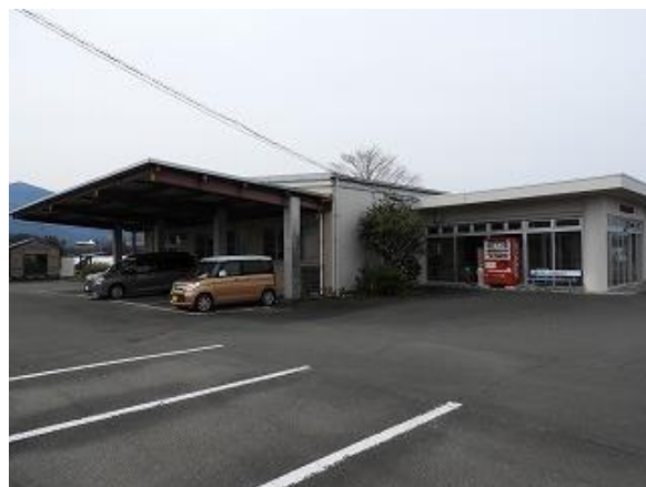
2) 旧上保健センター外観(北東側より)