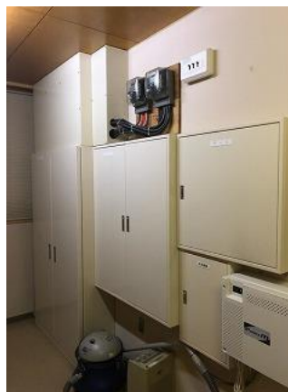
34) 旧上保健センター(記録保存室)電気 BOX