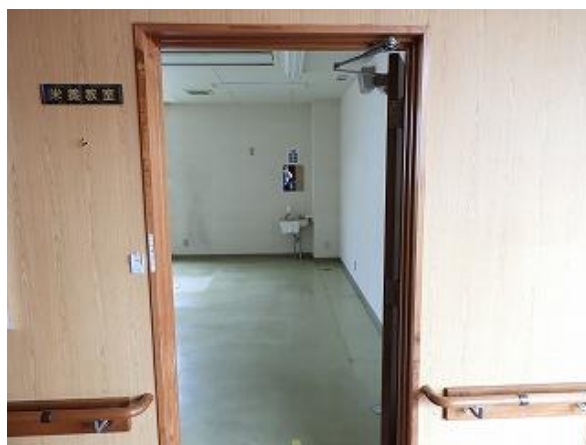
14) 旧上保健センター右側(訪問介護事業所)