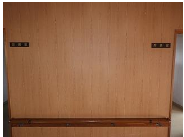
26) 旧上保健センター(問診室・診察室)外側