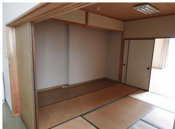
18) 旧上保健センター右側(和室)