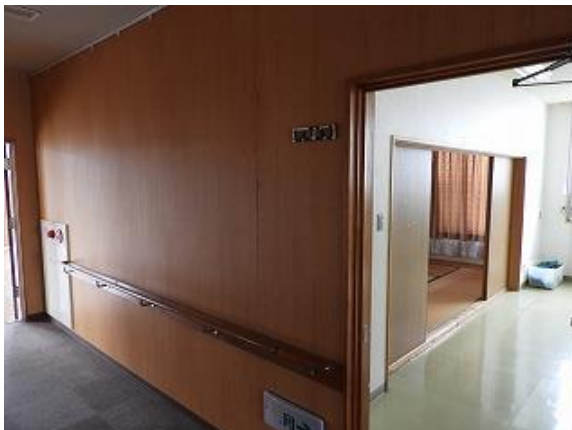
36) 旧上保健センター(訪問介護～和室)