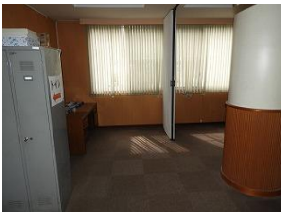
37) 旧上保健センターホール(トイレ側より)