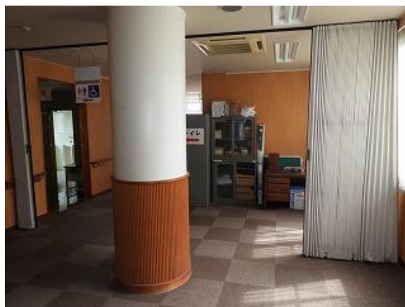
38) 旧上保健センターホール(西側→東側)