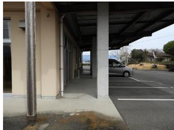
6) 旧上保健センタープラットホーム(南側)