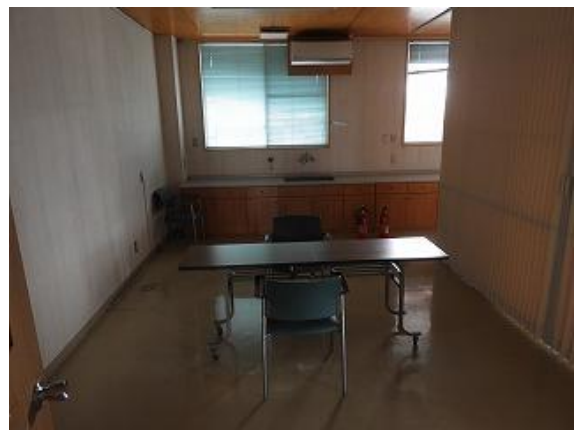
28) 旧上保健センター(診察室側)