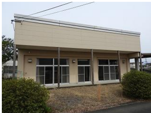
4) 旧上保健センター外観(南側より)