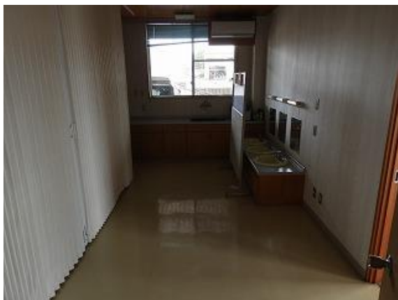
27) 旧上保健センター(問診室側)