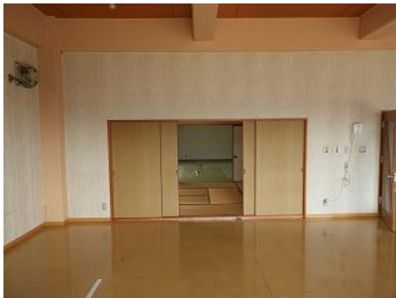
24) 旧上保健センター(集団検診室)和室側