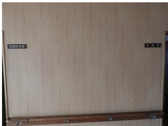
31) 旧上保健センター(記録保存室・準備室)