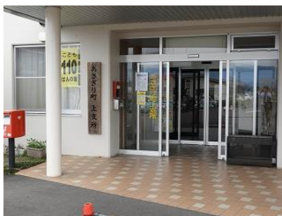
40) 旧上保健センター隣接上支所