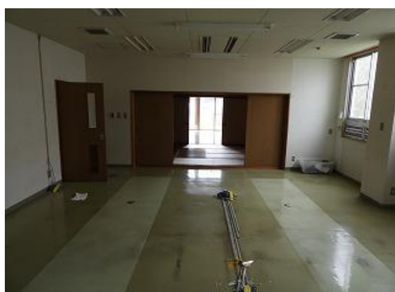
16) 旧上保健センター右側(訪問介護事業所)