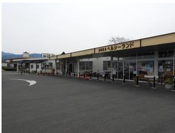
39) 旧上保健センター隣接ヘルシーランド