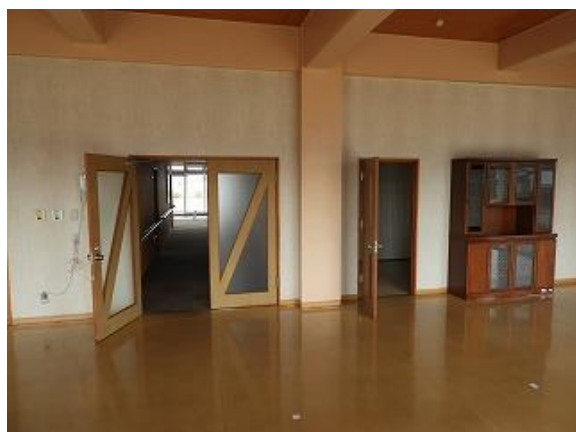
23) 旧上保健センター(集団検診室)北側