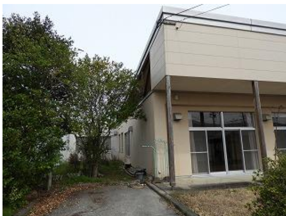
5) 旧上保健センター外観(南西側より)