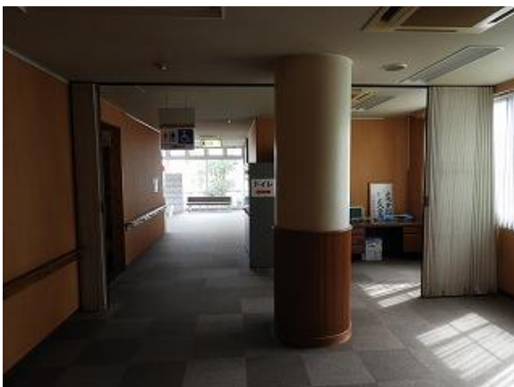
12) 旧上保健センタートイレ前ホール