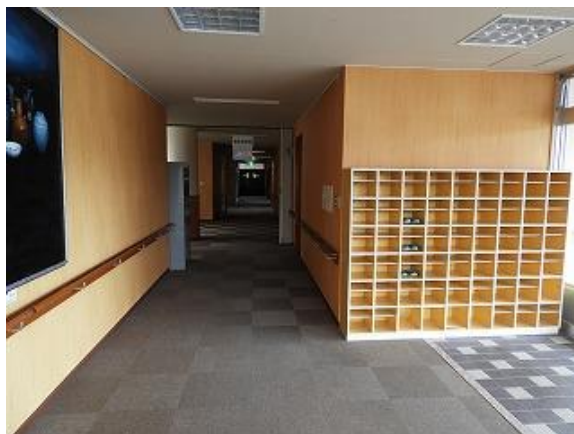
10) 旧上保健センター玄関(入室後右側廊下)