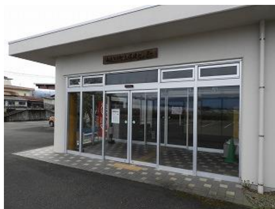
8) 旧上保健センター正面玄関