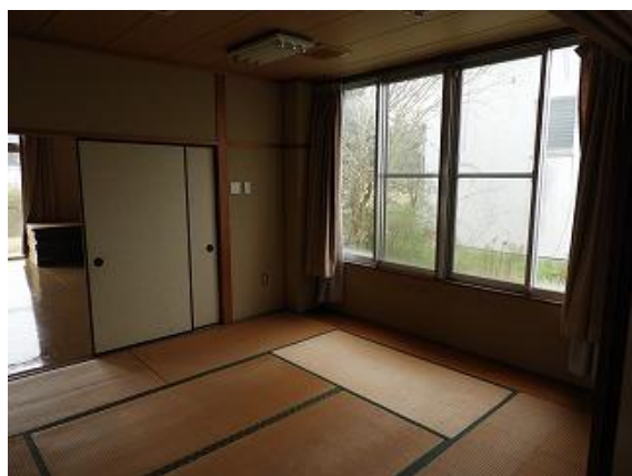
19) 旧上保健センター右側(和室)