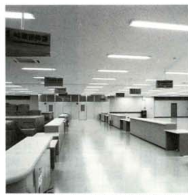
改修されたあさぎり町東庁舎内部

あさぎり町の組織・機構については、十九課二事務局体制となり、現免田町役場を本庁としてできる限り組織・機構の一元化を図ります。 しかし、現免田町役場内には全組織を配置することができないため、旧球磨勤労者体育館をあさぎり町東庁舎とします。 また、住民の利用の多い各種証明や申請などの行政サービスを行う支所を設置し、あさぎり町議会については、合併特例法