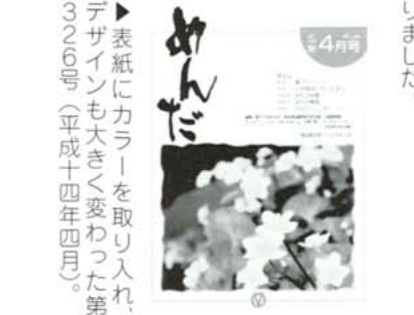
表紙にカラーを取り入れ、デザインも大きく変わった第326号(平成十四年四月)。

くま川鉄道がオープンし、新設された「おかどめ幸福駅」は話題を呼び全国各地から観光客が「しあわせ」を求めて押し寄せました。町内に街路灯が設置(元年)され、平成十三年には、保健センターやポッポ一館が相次いでオープンしました。ドラマ「クマノ物語」が制作され、本目遺跡には考古学者らが発見し、下水道事業の着工及び供用開始や国体も開催され、合併の話も加速しました。