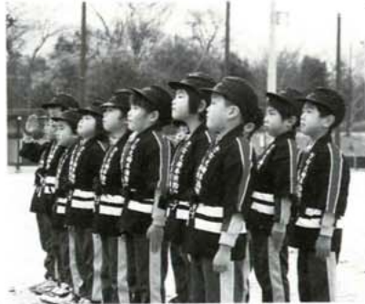
園児も負けずに「かしら〜なかっ!」