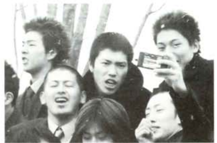
一緒に写真撮ろうぜ!