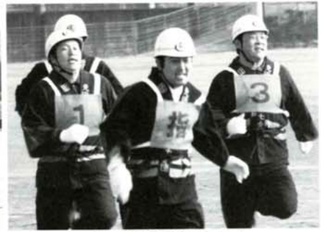
現地まで猛ダッシュ!