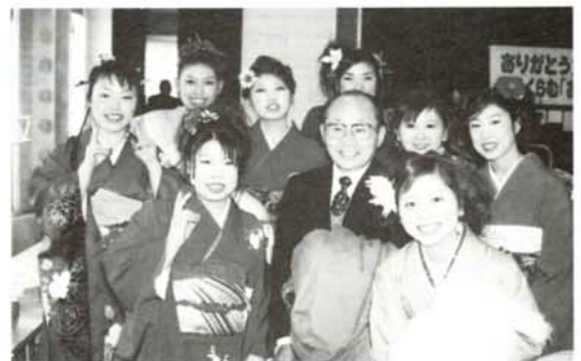
学校の恩師と「ハイ・チーズ」