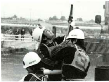
球を狙って必死の放水