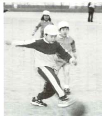
ゴールを狙ってシュート!

一月十九日、免田町最後となる新春町民サッカー大会が、免田町総合体育センターグラウンドにおいて開催されました。