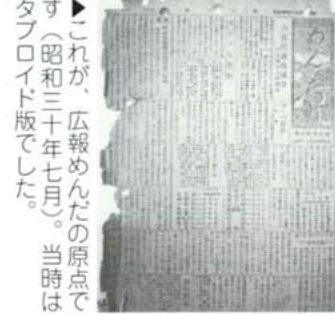
これが、広報めんだの原点です(昭和三十年七月)。当時はタブロイド版でした。