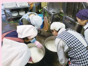
かずら豆腐作り(八代市坂本町)