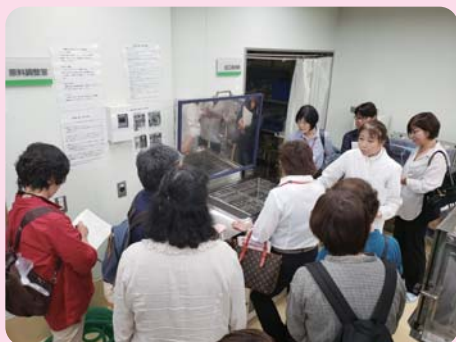
フードバレー アグリビジネスセンター(八代市鏡町)