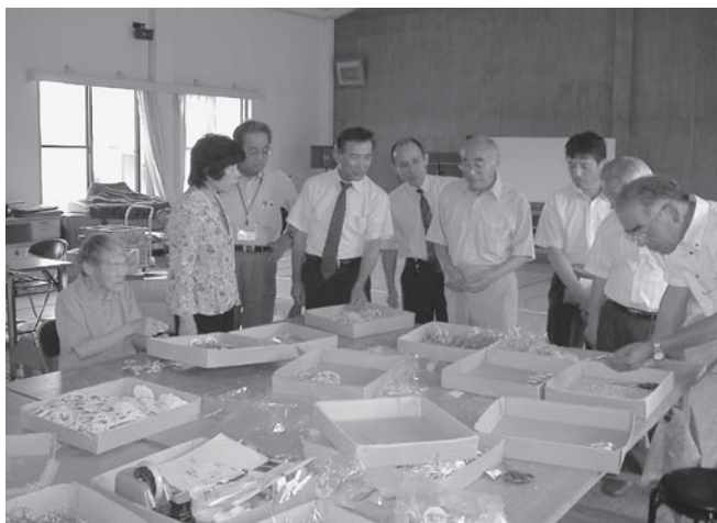
つつじヶ丘入所者の作業風景

五月二十二日(金)、前回に続き町内福祉施設の現況把握のため、①認知症対応型共同生活介護グループホームえがお②養護老人ホーム、特別養護老人ホーム翠光園③JAくま福祉の里・木綿葉④特別養護老人ホーム黒原荘、又会期中には知的障がい更生施設つつじヶ丘学園を訪問し、施設側から施設の概要について説明を受けたのち、質疑を行いました。