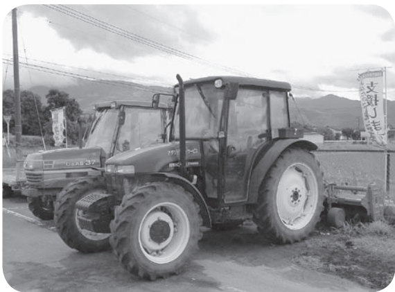
導入が進む大型機械

六十五歳以上の農業従 事者が八割を超えよう という状況のなか将来 のビジョンを伺いたい。 町長 第三セクターの 農業センターは難しい が人材育成を中心に進 めたい。高齢者に生き がい、女性は明るく働 ける農業づくりを目指 したい。