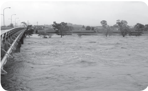
H20年6月、大雨で増水する球磨川