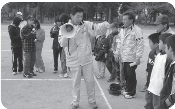
活動する体育指導員

山口 町民の方々の健康づくり、地域づくりに重要な役割を果たす体育指導員を減員したことにより、荷重になって、本来の指導員の仕事に影