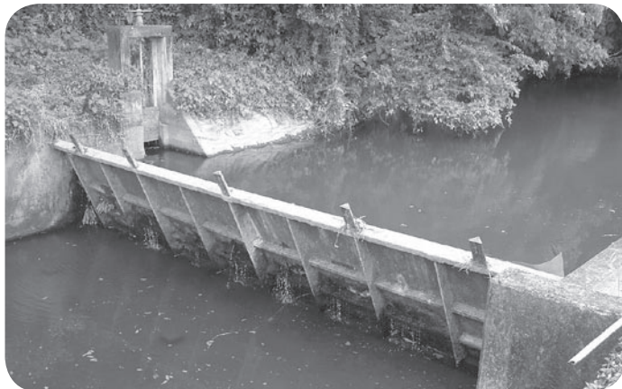
老朽化した柵木堰

産業振興課長 昭和四十六年に築造されている。老朽化が激しく、鉄板の腐食による漏水がある。その一キロ上流にある、柵木堰も同じ状況である。今、熊本の土地改良連合会に堰の長寿命化診断をお願いしている。