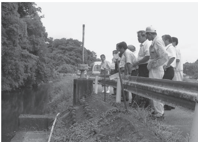
建設・経済常任委員会現地視察

畑地帯遊休農地の解消(薬草ミシマサイコ試験栽培地)、田頭川(赤岩堰、栴木堰)の現地調査