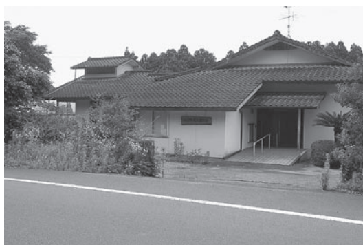
閉館される岡原老人憩の家

○多い時には年間八五〇〇人の利用があった岡原地区の老人憩の家が、施設の老朽化と行革により廃止されることになりました。