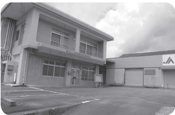
須恵地区集落営農組合の拠点