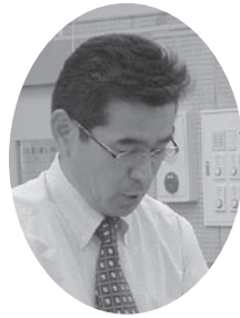
議員 緒方 勇二