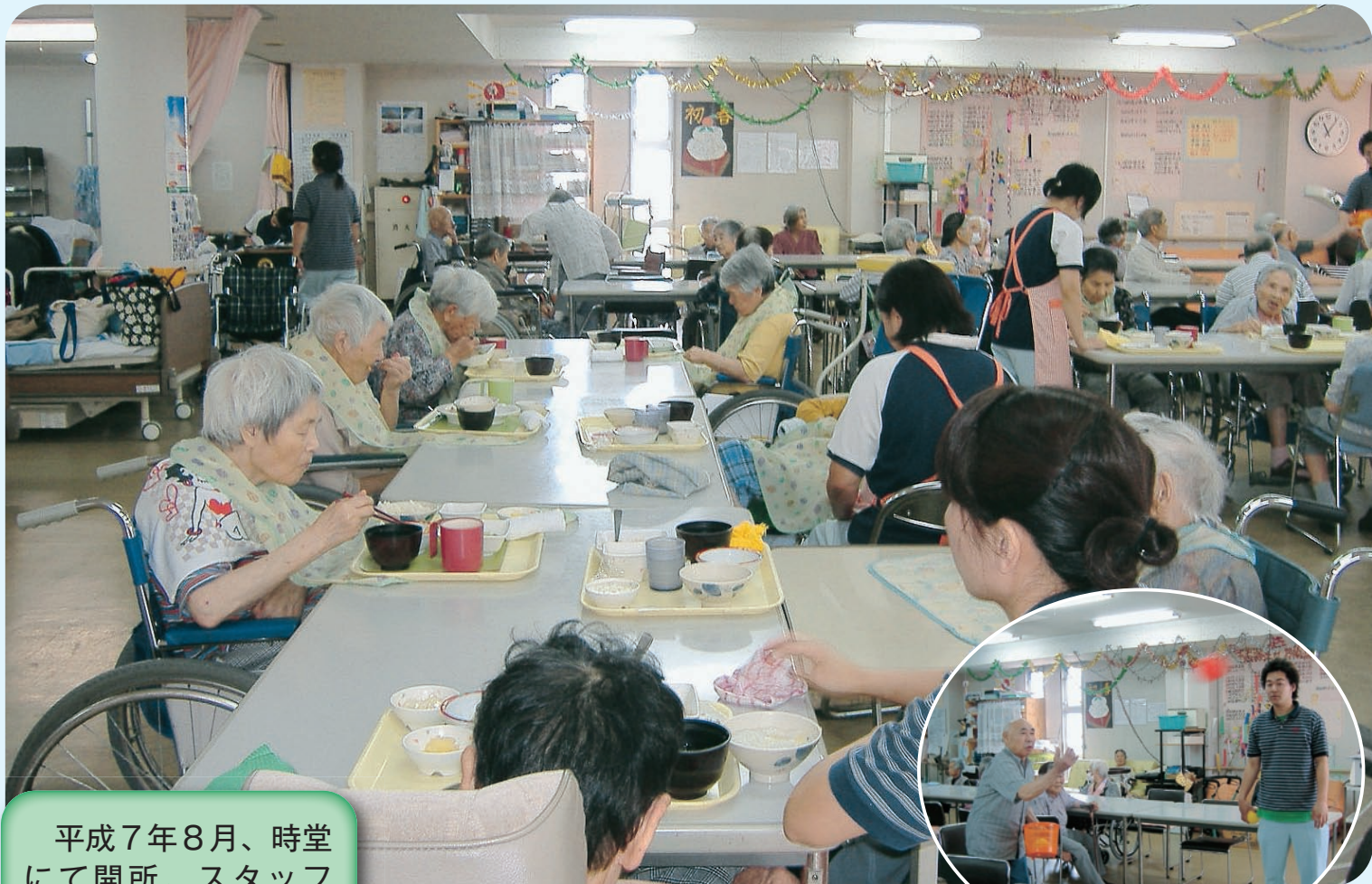
特別養護老人ホーム黒原荘

平成7年8月、時堂にて開所。スタッフ41名の体制で、入所者30名、ショートステイ6名、デイサービス30名を受け入れています。