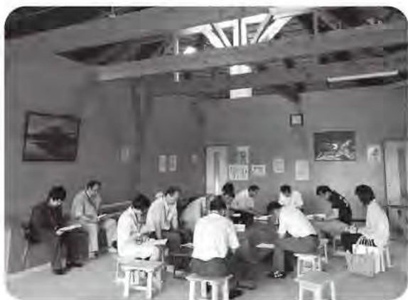
多良木町えびすの湯にて研修

第一回あさぎり町議会厚生常任委員会とあさぎり町温泉施設再編等に係る検討作業部会合同会議では、あさぎり町長の意向確認についてと喫緊の課題について調査した。その他ヘルシーランドリニューアル箇所の説明と多良木町ふれあい交流センター「えびすの湯」研修の説明を受けた。