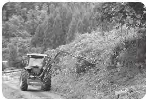
支援センターに導入されたアーム型草払機