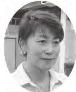
難波 文美 議員

難波 町内の豊かな森林資源、のどかな田園風景と文化財はもちろん、昨年登録された世界灌漑施設遺産の幸野溝と百太郎溝を生かしたフットパスを導入して今こそ地域づくりを推進する時期ではないか。