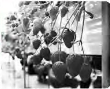
イチゴの高設ベッドによる栽培

問 産地パワーアップ事業について。イチゴの高設システムの補助金以外の農家自己資金について対象となる農家が融資を受けた場合の利子に対する支援策は。