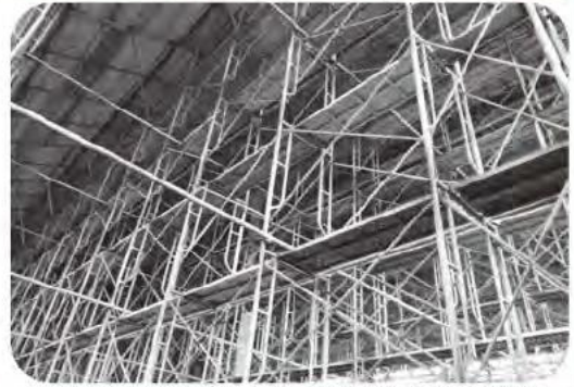
体育館内部の改修の様子・改修のための足場設置