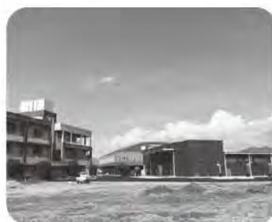
旧深田中学校跡地

町長 葉草加工場、体育館も農産物加工系に、グラウンド残地・校舎跡地に新たな加工場の誘致を考えている。