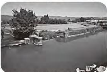
世界かんがい施設遺産の百太郎堰