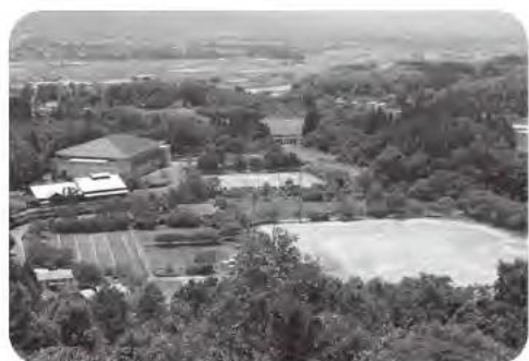
よりよいスポーツ交流の整備が進められる高山運動公園

建設林業課長 高山へつなぐ町道江島田頭川線の拡幅工事は、用地買収が順調に進むと、県道側から工事着工をしていきたい。