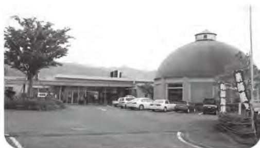
ヘルシーランド薬師温泉

溝口 ヘルシーランド温泉改修にあわせ、旧上村役場跡地にバイオマス発電施設の民間事業者を誘致できないか。廃熱を利用する事で温泉施設の経費削減ができ周辺のハウスの暖房費の削減、そして発電施設の熱源である未利用廃材の活用で山主(町有林・上財産区含む)の所得増、雇用の拡大につながるが。