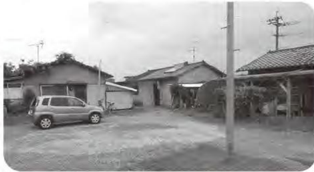
改築が計画されている竹野団地

建設林業課長 長寿命化計画によると建て替え計画は前半5年で竹野・別府団地、後半5年で丸尾・下道団地を予定しているところであるが、建て替えを行う上では補助金を受ける必要があるので、計画に列挙させていただいている。