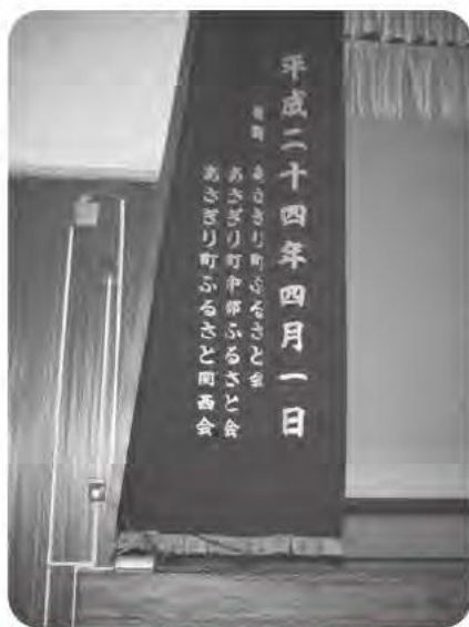
中部・関西ふるさと会から寄贈されたあさぎり中学校の綴帳（どんちよう）

企画財政課長 ふるさと関東会・ふるさと関西会・ふるさと中部会3つあり、総会をふる