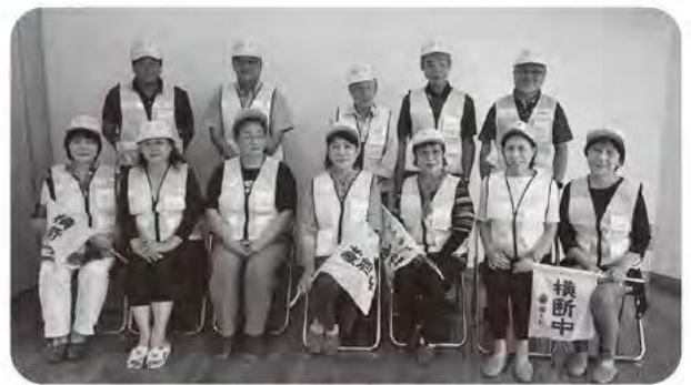
上地区で立ち上がった民生委員の見守り隊

副町長 地域での全体でカバーしあう見守りとしてほしいと思っており、外部との連携がどうできるか検討を重ねていきたい。