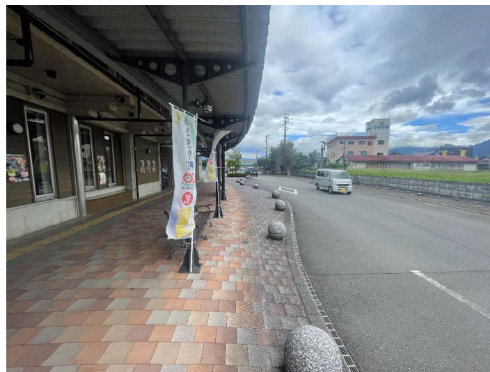
⑤ ポッポー館前歩道スペース / ⑥ 町道免田駅前線