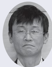
★荒木 一郎 覚 井