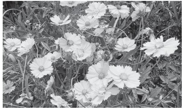
▲オオキンケイギクの花

オオキンケイギクは、日本の生態系に重大な影響をおよぼすおそれがある植物として、外来生物法による『特定外来生物』に指定され、栽培、運搬、販売、野外に放つことなどが禁止されています。