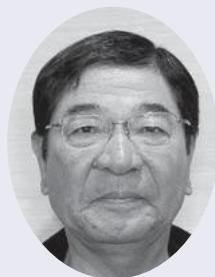
★西 重盛 屯 所