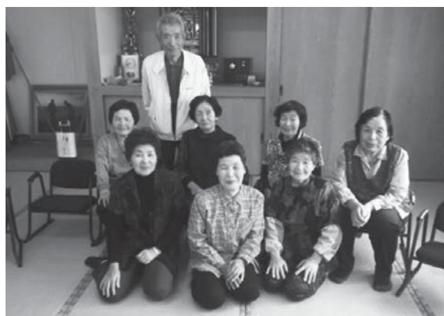
▲カメラマンも笑顔になる、よか表情でした～