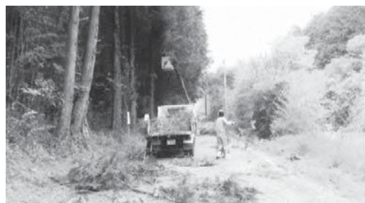
▲道路の陰切作業（高所作業車を借りて）