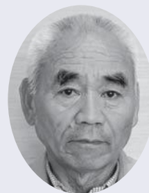
國政 輝人 吉井住宅