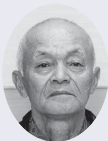
川野 岩己 久 鹿