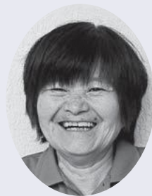
★神田 栄 皆 越