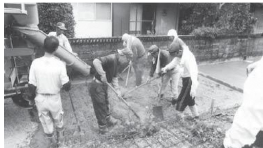
▲未舗装道路をコンクリートで舗装（協働作業中）

公共性のある施設等の整備や工事を、地域のみなさん自ら取られる場合、必要な資材や機械の経費を町から支給する制度を設けています。