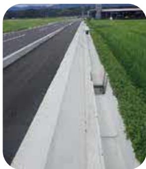
防草コンクリート

答 堂ノ下・堀之角線、免田百太郎線と別府線の3路線を防草コンクリート、免田川南線の1路線を防草シートで計画している。道路改良事業工事は、黒田古町線を防草コンクリートで、岡原免田線を防草シートで法面の一部防草工を計画している。