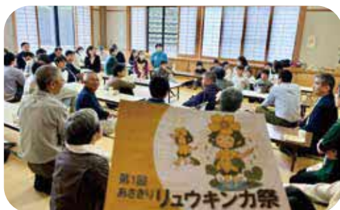
沢山の参加があった祭り

ふるさと納税に絡めた 推奨商品のPRや町民に 向けたメッセージの発信 の仕方やコンテスト的な ものも含めて、まずは 知っていただく取り組み は必要。あさぎり商社を 中心に一緒に取り組んで いきたい。