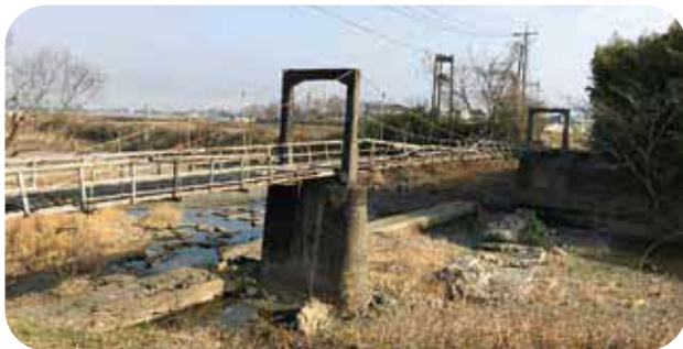
現在の石田橋の状況

理河川免田川の柳別府区と塚脇区をつなぐ、今では希少となった木製の吊橋で、百太郎溝整備時に架設され長い歴史を刻んだ文化的、教育的な貴重な土木遺産である。この木橋は免田川とサイフォンで交差して流れる百太郎溝管理堤防道路の一部区間をなす橋架であり、溝管理、免田川堤防や隣接水田の管理においてもなくてはならない大変重要な橋架である。しかし、ここ10年近く老朽化を理由に修繕もされず放置され通行止めとなっており、免田川で地域間が分断され、不便を強いられている等の内容で、令和6年4月に柳別府・塚脇区長、百太郎