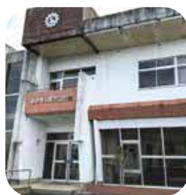
あさぎり町商工会

あさぎり町商工会から出された要望書について、「総務建設経済常任委員会としては、採択」とした。