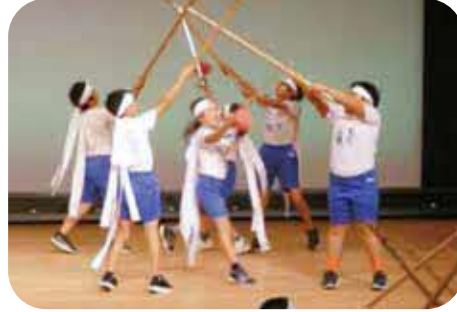
須恵小150年式典で披露された棒踊り

答 地元の方に伝統芸能の重要さを理解していただき、継承いただきたいと考えている。