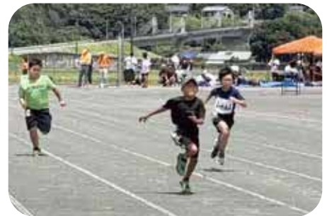
人材育成に繋がる大会への参加

近年の物価高騰等を踏 まえ開催地ごとの設定も 必要だと考えている。部 活動の地域移行に併せ近 隣町村の状況を確認し分 析していきたい。