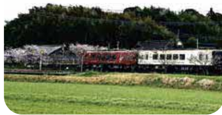
9月20日全線開通のくま川鉄道

答 線路の維持管理は、くま川鉄道管理機構が業者に委託して行うと聞いている。イベントについては、1月30日に「くま川鉄道全線運航再開関連イベント実行委員会」が設立されたので、組織された担当会で検討されていく。