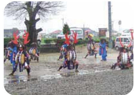
伝統芸能・太鼓踊り