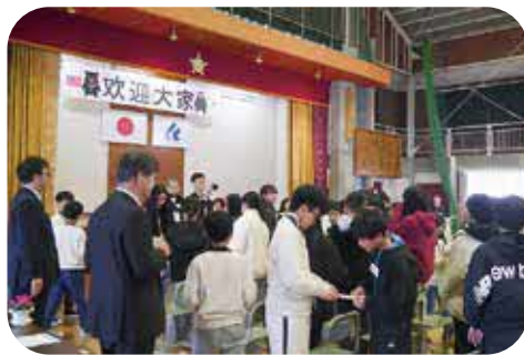
台湾の小学生との交流

建設課長 規則等を精査して、改 正がいいのか検討する。 問 公営住宅空き室 対策と周辺の清掃 は行き届いているのか。