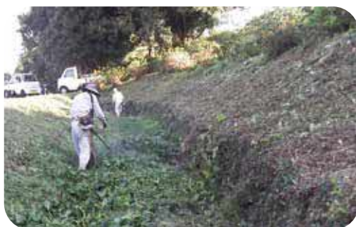
中山間地・危険な高畦の除草作業

農業加算では、協議会でドローンを購入し、農地の防除を実施する。ドローンのオペレーターについては、希望者に5月から購入先での講習会と認定試験を受け資格を取得して頂く計画である。