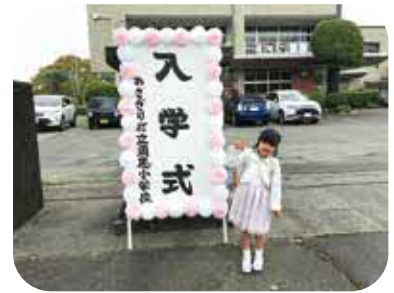
「あさぎり町入学祝金事業」 が始まります。

町内に住所を有し、人 吉球磨地域等の企業に雇 用され、または起業して いる者に対して、返還中 奨学金の3分の2を補助 することにより若者の町 内への移住定住の促進を 図り、本町の課題となっ ている担い手不足の解消 や持続可能な地域経済活