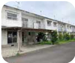
政策的空き部屋が 27ある下道団地

問 外国人が安心し て暮らせる環境を 整えるための「※共生社 会の実現」の施策は、重 要である。外国人の公営 住宅入居に関する条件等 に関し、国から通知が出 ており条例や要綱等を整 備すべきではないか。