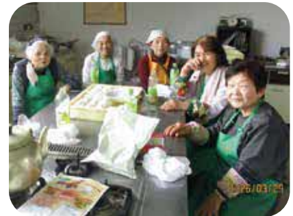
シルバー人材センター会員活動

会員数が一番多い時期は、平成25年の213名で、現在は半減している。今の運営状況だと赤字に転落することが目に見えており、補助金や人員体