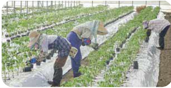
シルバー人材センター農業ヘルパーの様子

今後、山間の農地や耕作放棄地になりそうな農地の保全は重要な課題だと考えていて、農業支援センターの在り方、体制や業務内容等について検討を続ける必要があると感じている。