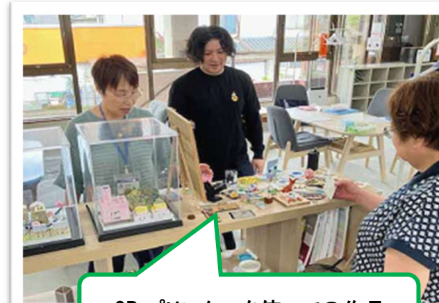
3Dプリンターを使っでの作品