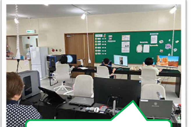
パソコンを使っでの自由学習