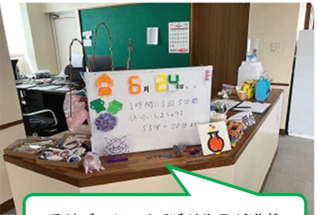
受付デスクには手造り作品が満載

2024年 4月に水上村に開所したオープンラボ「しとらす」を訪問しました。10歳から18歳を対象に、テクノロジーを通じて創造的で自由な活動ができる居場所づくりをされています。ロボットプログラミング、イラスト制作、映像制作、音楽制作、レーザーカッターなど充実。