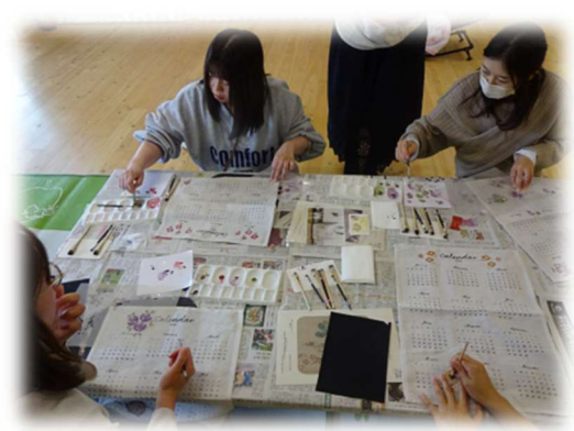
摩耶幼稚園ハッピーサークル ステンシルカレンダー