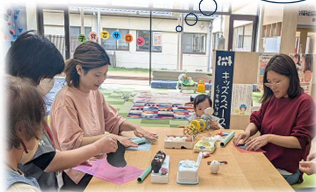
社会福祉協議会子育てサロン クレイアート