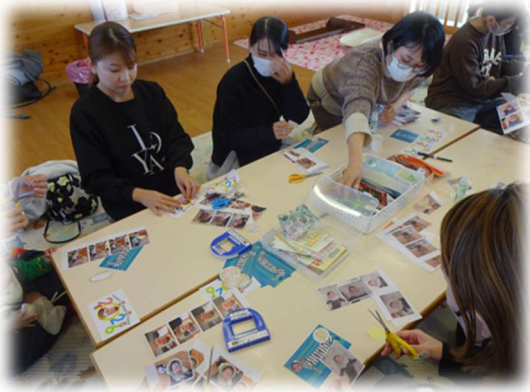
専立寺こども園ひよこサークル 年賀状作り